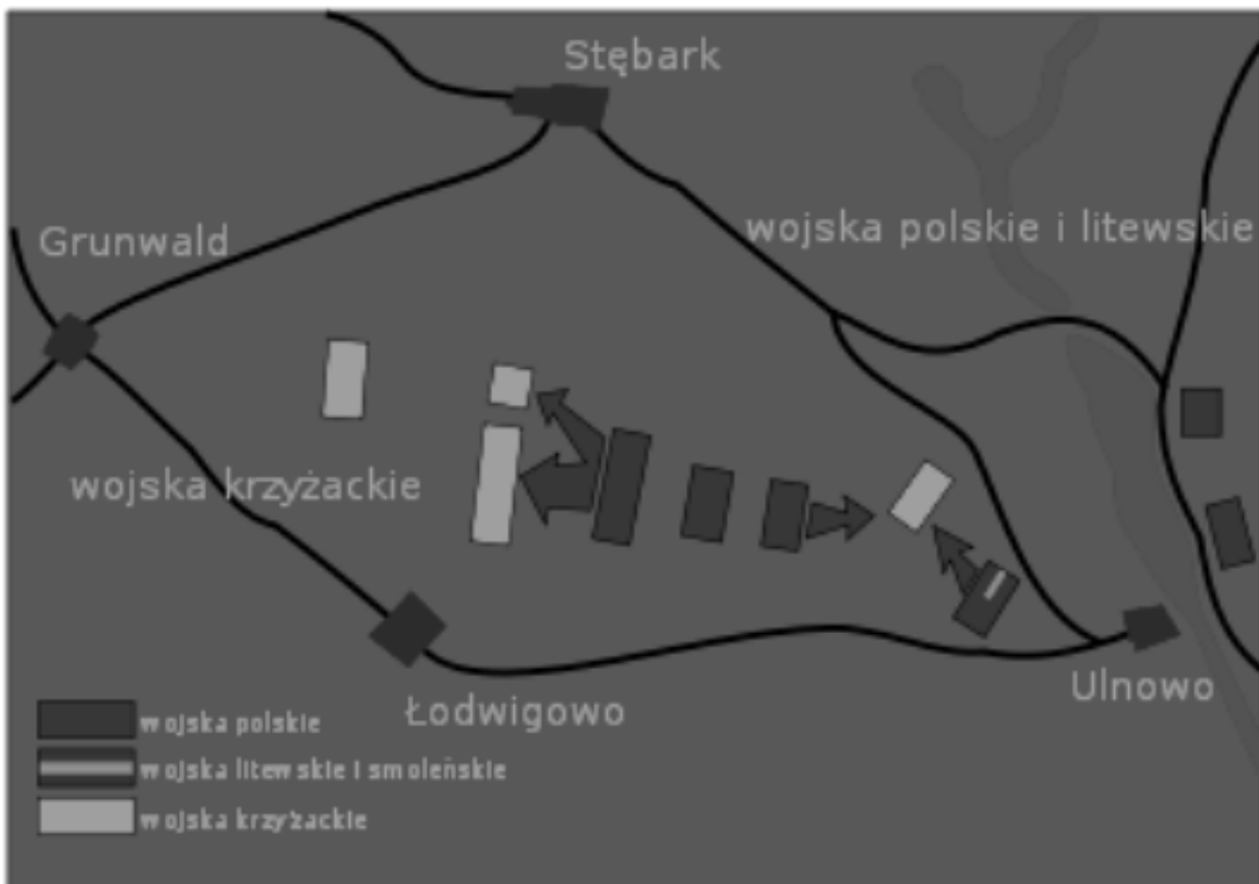
IV faza bitwy pod Grunwaldem.