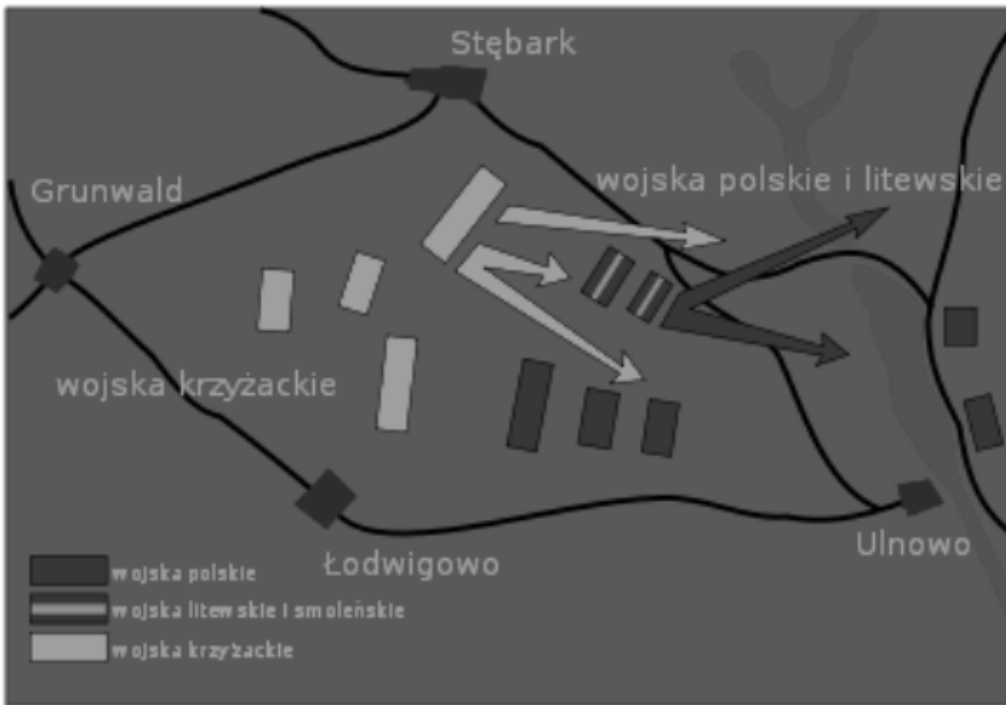
II i III faza bitwy pod Grunwaldem.