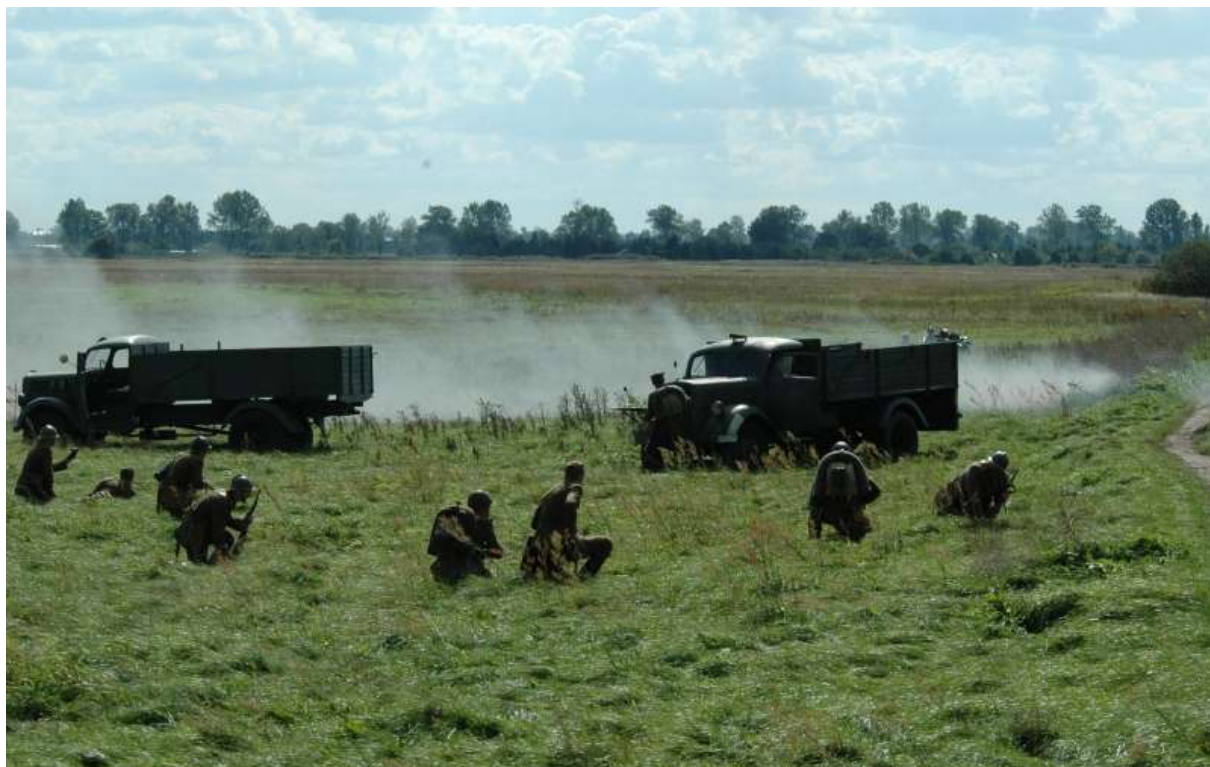
Grupa rekonstrukcji historycznej – inscenizacja fragmentów Bitwy nad Bzurą